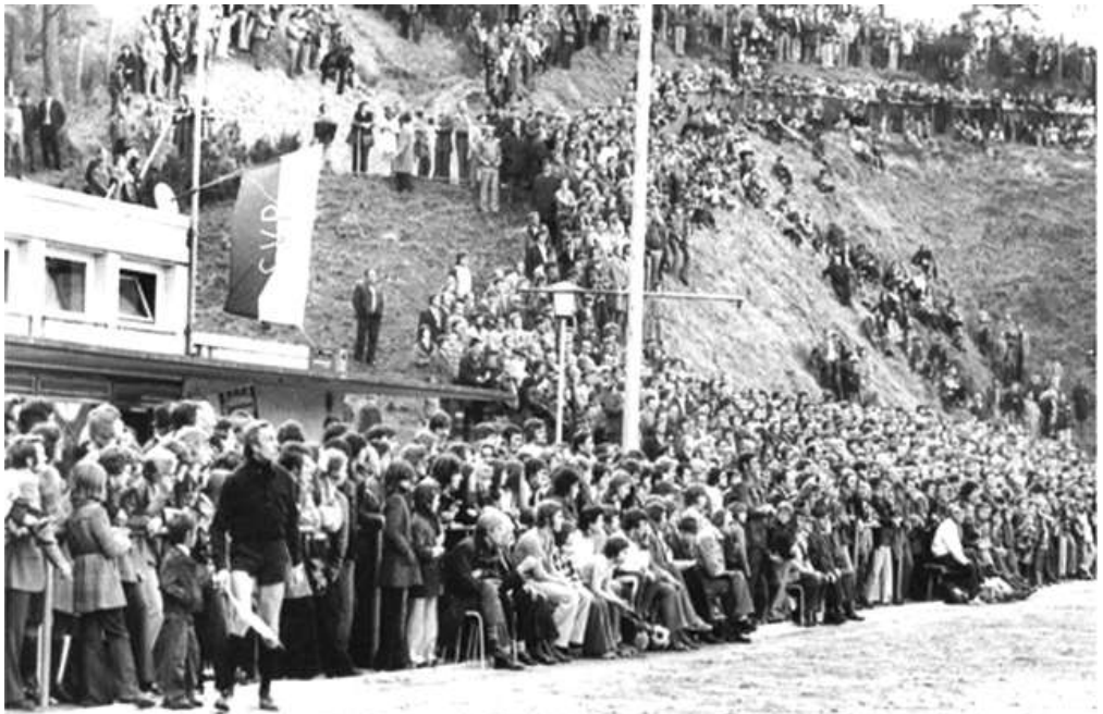
Zuschauermassen zu Amateurligazeiten

Das waren noch Zeiten, von denen heutzutage jeder Amateurverein träumt. Zuschauermassen, wie damals zu Amateurligazeiten in der 70er Jahren sind in diesen Zeiten, auch ohne Corona, unvorstellbar. Jeder nur erdenkliche Platz rund um den ehemaligen Hartplatz wurde damals genutzt, um die Spiele der 1. Mannschaft zu sehen. 2000 Zuschauer waren bei den hochkarätigen Spielen keine Seltenheit. Der Mittelberg war ein hart umkämpfter und gefürchteter Fußballort. Manch top besetzte Mannschaft mit ehemaligen Profispielern hatte größten Respekt vor diesem Platz und vor allem vor diesen zahlreichen und fanatischen Zuschauern und Fans. Es war aber auch wie ein Volksaufmarsch und Volksfest am Spieltag den Mittelberg zu erklimmen und seinen Bühlertaler Fußballidolen zuzujubeln. Auch wenn es diese Zeiten so schnell nicht mehr geben wird, so wäre es dennoch schön, wenn zu den Heimspielen des SVB wieder einmal größere Zuschauermassen auf den Mittelberg strömen würden. Fußball lebt nun mal von den Emotionen und Zuspruch und Anfeuerung motivieren umso mehr!