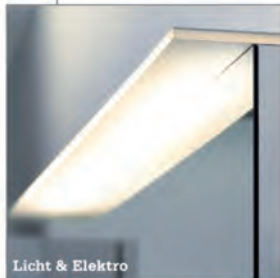
Licht & Elektro

schneidertes Bad aus einer Hand. Vom kleinen Bad bis zur Badelandschaft überzeugen wir Sie mit Ideen, Know-how und einem zuverlässigen Meisterteam.