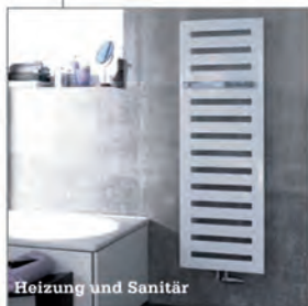
Heizung und Sanitär